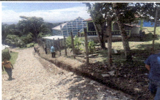
Foto 3: OPf junto a ingeniero midiendo cercado de malla en mal estado.